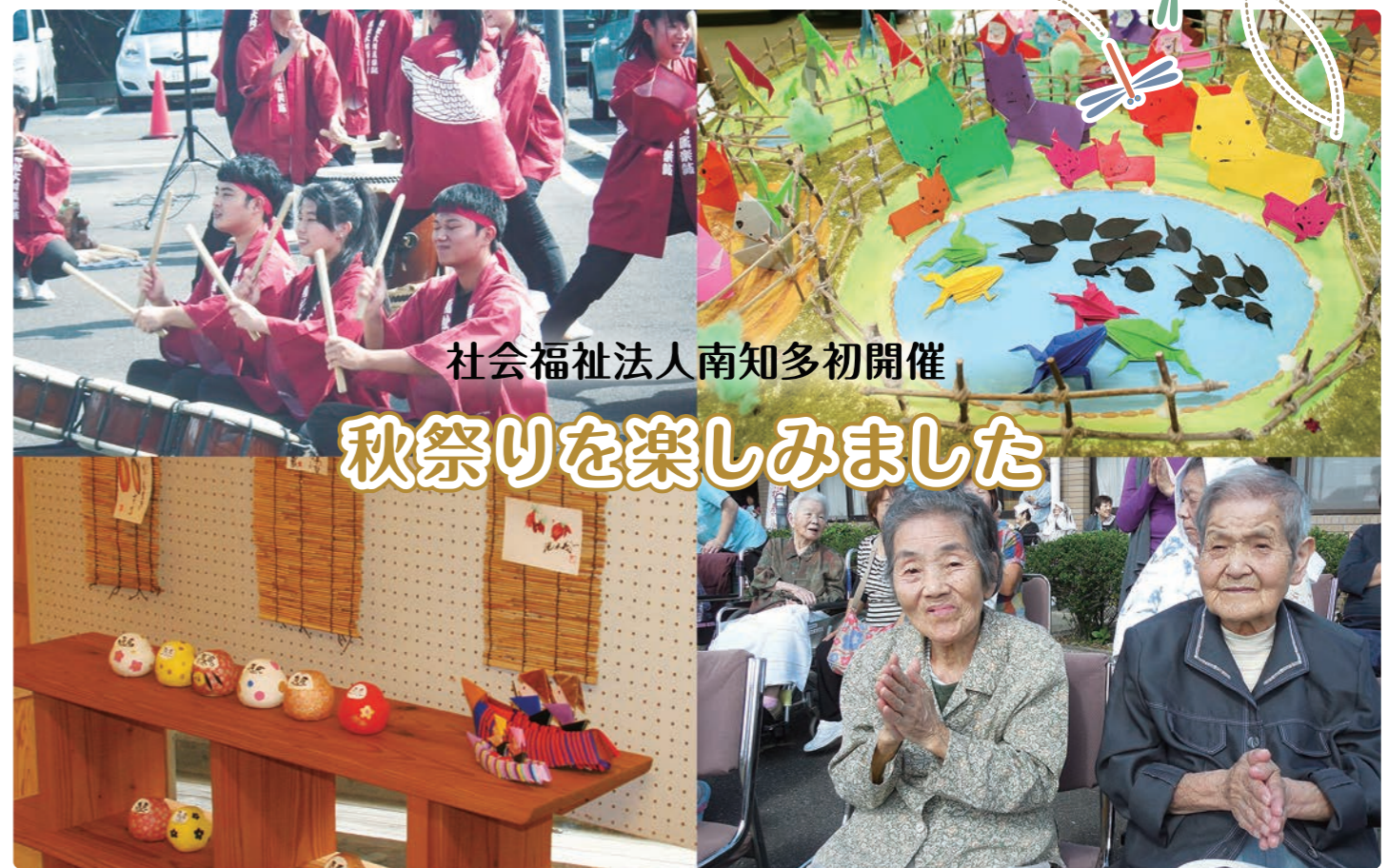
社会福祉法人南知多初開催