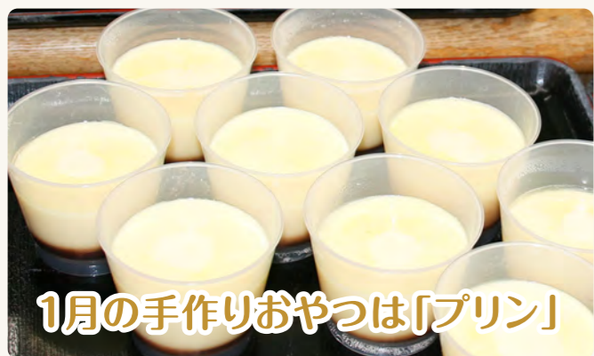
1月の手作りおやつは「プリン」

日頃から訓練をしっかり行い、すばやい対応と共に、発生させない予防をしっかり行っていききたいと思います。